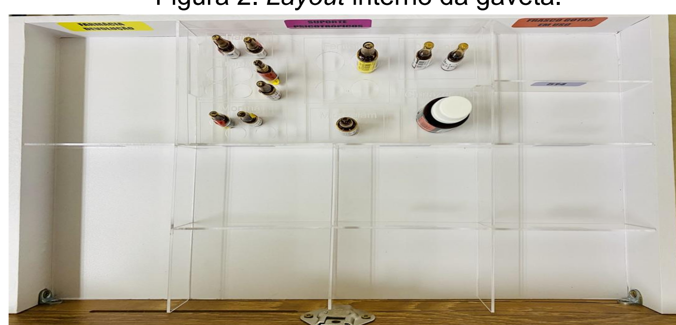
Figura 2. Layout interno da gaveta.