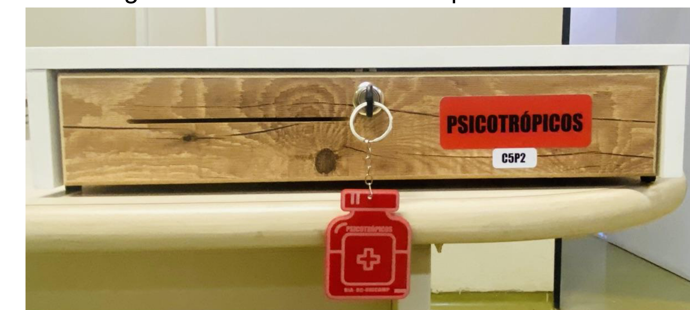
Figura 4. Controle de acesso por chave.