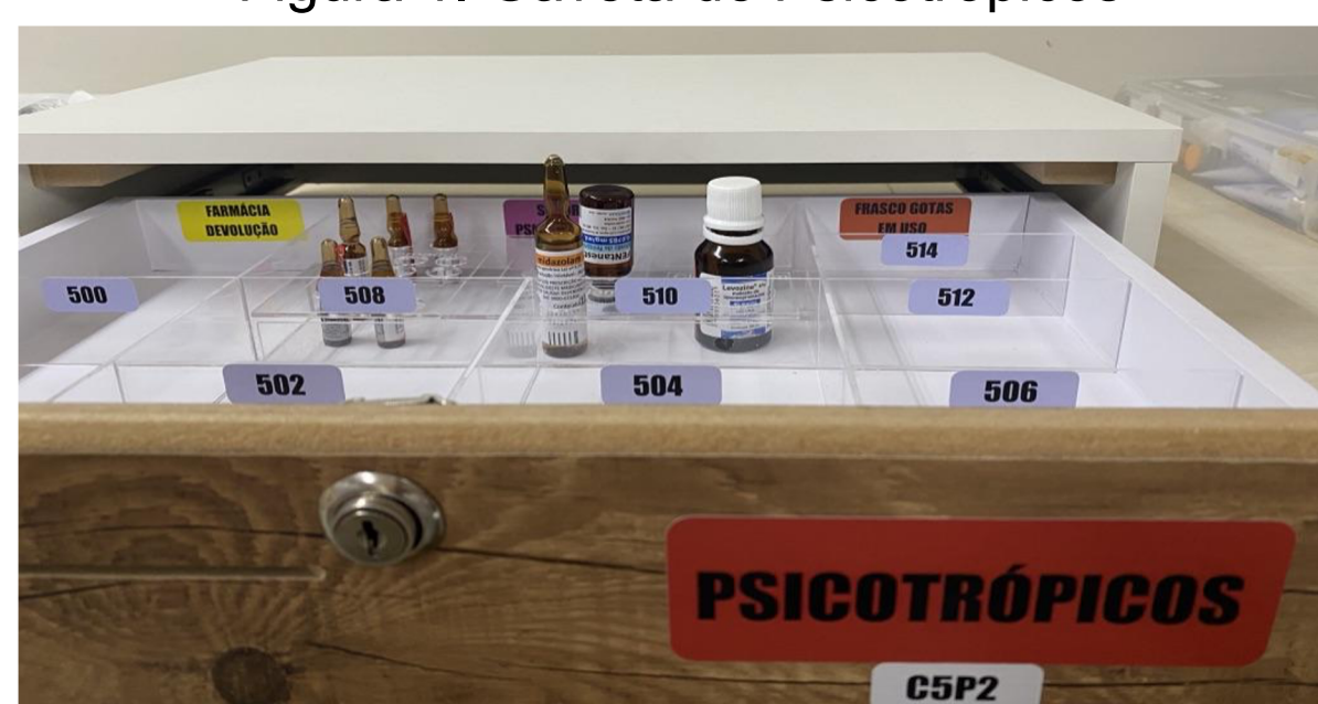
Figura 1. Gaveta de Psicotrópicos